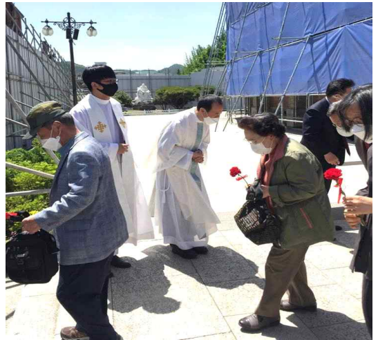
△ 어버이날 행사와 본당의 날 카네이션 나눔행사 (2021/5/9/주일 교중미사)